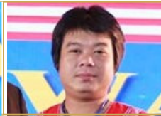
LER WAH (USA)