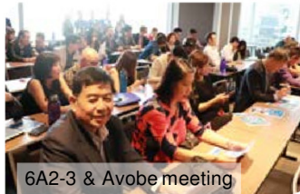
6A2-3 & Avobe meeting