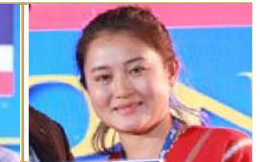
WANADOON KALAYA (THAILAND)