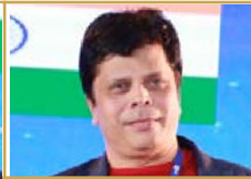
BHAURAO RAMDAS PATIL (INDIA)