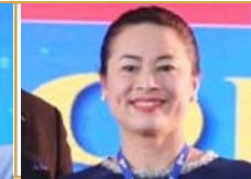
THI HOP LE (CZECH REP)