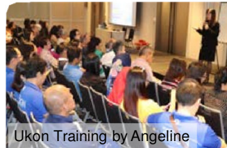
Ukon Training by Angeline